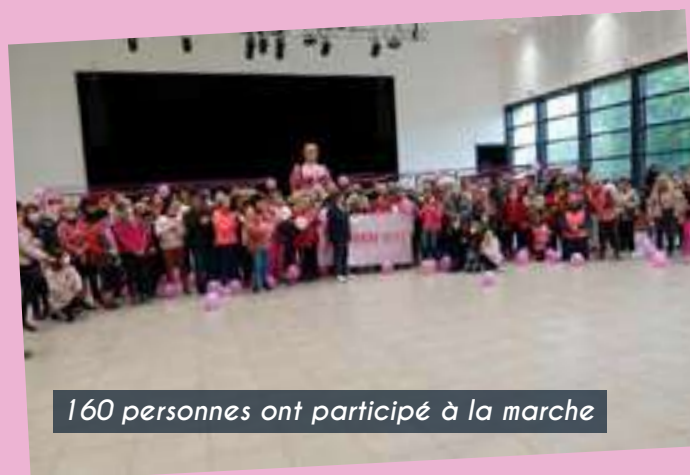
160 personnes ont participé à la marche

Parlez-en autour de vous, encourageons le dépistage !