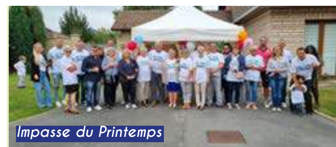
Impasse du Printemps