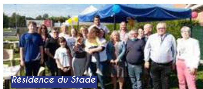
Résidence du Stade