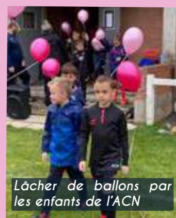
Lâcher de ballons par les enfants de l'ACN