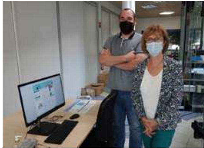
Un poste informatique est à la disposition des Noyellois, en mairie, afin de leur permettre d'effectuer leurs démarches.

Officiellement mis en service à la rentrée de septembre, le Portail Famille de la Ville de Noyelles-Godault vous offre la possibilité d'inscrire votre enfant à de nombreux services municipaux ! Le Portail Famille vous permet de vérifier vos inscriptions aux activités proposées par la Ville, de consulter et de payer vos factures en ligne et de saisir des demandes de réservations aux activités. Les inscriptions aux accueils de loisirs des vacances scolaires sont possibles jusqu'à deux semaines avant le début de la période de vacances. Pour le CAJ, les inscriptions sont réalisables jusqu'à 48h avant le début de l'activité.