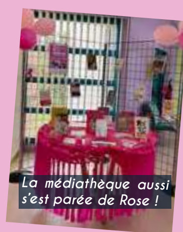
La médiathèque aussi s'est parée de Rose !