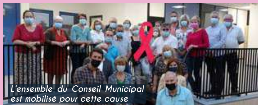
L'ensemble du Conseil Municipal est mobilisé pour cette cause