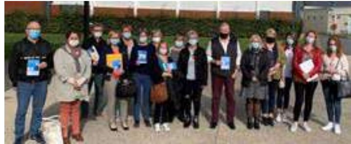
Une quinzaine de partenaires (caisses de retraites AGIRC et ARRCO, CARSAT, la Médiathèque, la Maison des aidants, la Maison de l'autonomie, Le béguinage Floralys, le PIMMS, associations sportives et culturelles...) étaient présents pour proposer leurs services aux séniors et aux aidants familiaux lors du Forum «Bien vieillir».

Semaine Bleue est également de mettre en avant la solidarité entre toutes les générations pour faire de Noyelles-Godault une ville bienveillante et résiliente.