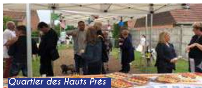
Quartier des Hauts Prés